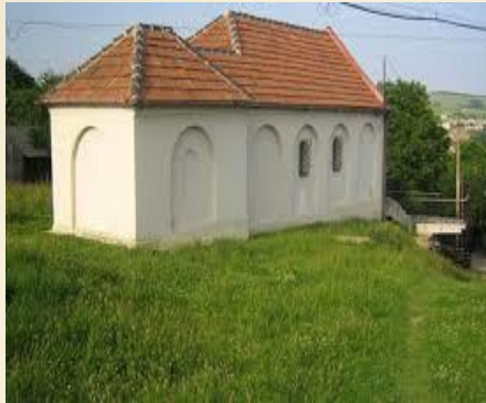
ה'אהל' ע"ג ציונו הק' של הרה"ק רבי מאיר מפרמישלאן

מפרמישלאן זיע"א ואמר לי בזה"ל: "איך האב איבער געלאזט א גלאונעלע וויל מען עס אויסלעשען, זאג איך דיר אז ידך אל תהי בו" [השארתי כאן בארץ ניצוץ קטן ורוצים לכבות את זה, אני אומר לך שידך לא תהיה בדבר הזה].