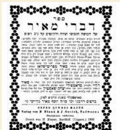
ליקוטי תורות מהרה"ק מפארמישלאן

שמע האיש את דברי הרה"ק מפארמישלאן זי"ע ושמח שמחה גדולה כי יזכה להעניק מכספו לרבו הק' השרף זי"ע"א, ונסע אל ביתו והכין את כל צורכי הסעודה כפי שאמר לו הרה"ק מפארמישלאן, והנה כדברי הרה"ק מפארמישלאן כן היה שבאותו שבוע היה גשם כבד מאד ואין יוצא ואין בא מעיירה לעיירה, ומשום כך גם לסטרליסק לא נסע אף חסיד, והנה מנהגו של רביה"ק השרף זי"ע"א היה שלא השאיר בביתו סכף כלל, ובהיות ובאותו שבוע לא באו חסידים לרביה"ק זי"ע"א ממילא לא היתה הפרוטה מצויה בכיס כלל.