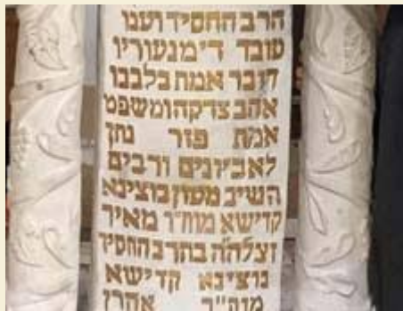
מציבת ציונו של הרה"ק מפרמישלאן

עוד הם מדברים והנה באה עגלה ובתוכה יושב הרה"ק רבי מאיר מפרמישלאן זיע"א ונעצרה על יד הרה"ק מראפשיץ זיע"א ועגלת השליחים, ואמר להם הרה"ק מראפשיץ "אבי אמר שהניח א גוועלענע, אין איך זאג אז ער האט איבער געלעזט א פלאם פייער" [אבי אמר שהניח ניצוץ קטן ואני אומר שהוא השאיר להבת אש] והמשיך בנסיעתו.